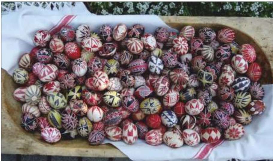
Fekete Ildikó díszített tojásai